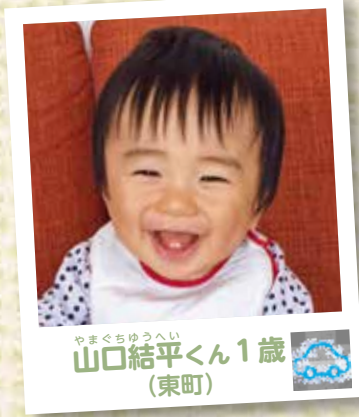
やまくちゆうへい 山口結平くん1歳 (東町)