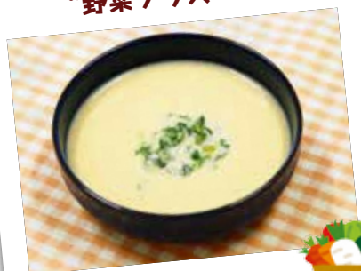
かぶのポタージュ