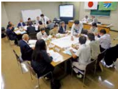
▼建設候補地検討委員会会議の様子