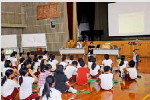
◀御前崎市と原子力発電所の歴史を学んでいる様子

大学や中部電力の協力のもと、独自のエネルギー教育カリキュラムを作成し、本年度から取り組みを開始しています。今後も「産学官」それぞれの立場で協力し合い、エネルギー教育の取り組みを進めていきます。