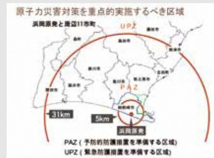
▲原子力対策重点区域図

市では、平成29年3月に「原子力災害広域避難計画」を公表しました。この計画は、浜岡原子力発電所における重大事故の発生に備え、市域を越える広域的な避難に必要なルールや体制などを定めたものです。 原子力災害では、原子力施設の状況に応じて緊急時の対応が3つに区分されています。①御前崎市内で震度6弱以上の大地震が発生した場合の「警戒事態」では、高齢者など避難に時間を必要とする要配慮者が避難準備を開始します。②全交流電源喪失などの「施設敷地緊急事態」では、要配慮者は一般市民よりも前に避難が開始されます。③冷却機能喪失などの「全面緊急事態」では、全市民の避難が開始されます。これらの行動を迅速に行うことがこの計画の目的です。原子力災害発生 市では、平成29年3月に「原子力災害広域避難計画」を公表しました。この計画は、浜岡原子力発電所における重大事故の発生に備え、市域を越える広域的な避難に必要なルールや体制などを定めたものです。 原子力災害では、原子力施設の状況に応じて緊急時の対応が3つに区分されています。①御前崎市内で震度6弱以上の大地震が発生した場合の「警戒事態」では、高齢者など避難に時間を必要とする要配慮者が避難準備を開始します。②全交流電源喪失などの「施設敷地緊急事態」では、要配慮者は一般市民よりも前に避難が開始されます。③冷却機能喪失などの「全面緊急事態」では、全市民の避難が開始されます。これらの行動を迅速に行うことがこの計画の目的です。原子力災害発生 市の避難方法は、おおむね半径5キロ以内のPAZとUPZで避難方法が異なり、本市は市内全域がPAZ圏内であることから、放射性物質の放出前に全市民の避難が開始されます。市では、避難を迅速・確実に実施できるよう、より実効性のある計画にしておくために、原子力防災訓練などによる検証を含めさらなる検討を進め、避難計画への反映や関連する計画、マニュアルなどを作成してまいります。