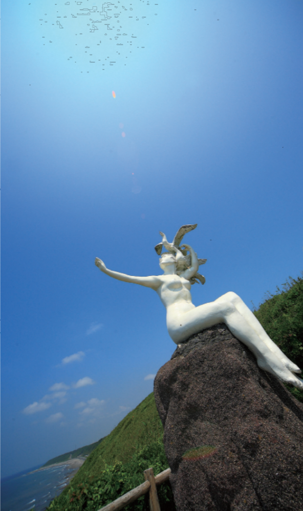
1.「夕日と風が見えるん台」は水平線に沈む夕日が見える 2.「地球が丸く見えるん台」 3.灯台の向こうに朝日も見える