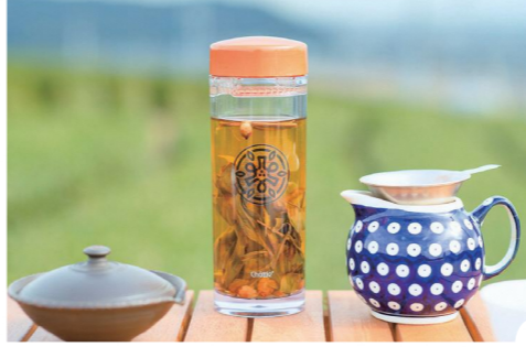
1.茶畑の向こうに駿河湾や富士山も見える 2.オプションでほうじ茶作り体験も 3.香り豊かですっきり飲みやすい「釜炒り茶」

☎054-251-5937(するが企画観光局) 🏠牧之原市勝俣2695 🕒10:00~18:00で4部制、体験時間90分、3日前までにHPから要予約(HPは[茶事室]で検索を) 📞不定休、雨天時 🍷1人3000円(お茶セット付) 🚗2台