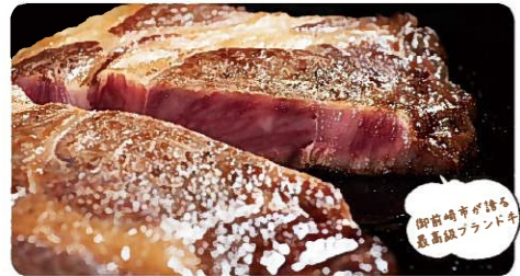
御前崎産の鮭、炭火焼く

●店舗などの詳細は御前崎市ホームページへ https://www.city.omaezaki.shizuoka.jp/kanko/