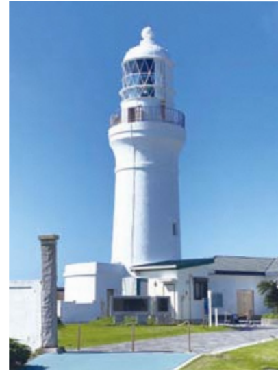
国指定重要文化財 御前埼灯台