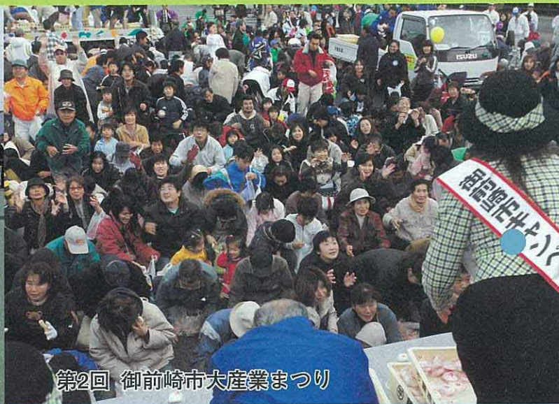
第2回 御前崎市大産業まつり