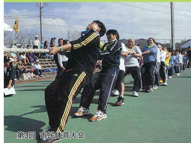
第3回 市民体育大会