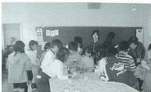
第一小放課後児童クラブ

答 8月から毎月1回社会福祉協議会の一室を借り、試行的に実施しています。具体的に開設場所は決定していないが、19年度から毎週、何日か実施できるように検討をしています。