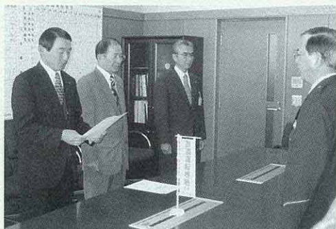
菊川警察署長に提出