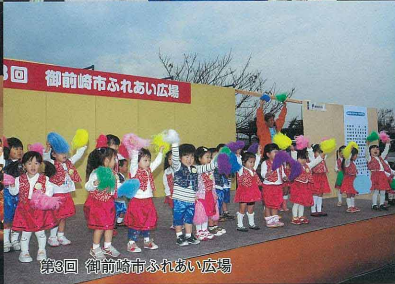
第3回 御前崎市ふれあい広場