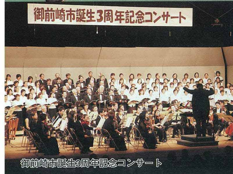
御前崎市誕生3周年記念コンサート