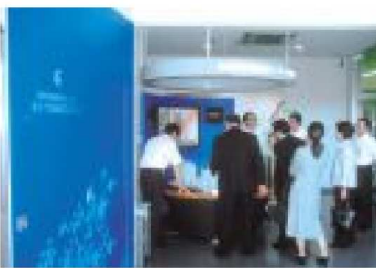
環境放射線監視センター