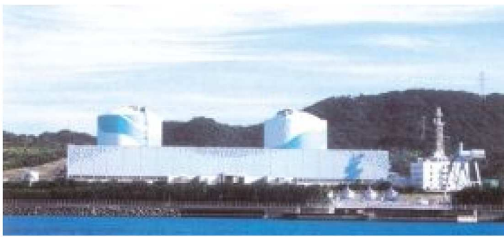
川内原子力発電所

・環境放射線監視センターの役割と原子力災害時の対応について研修しました。 ・九州電力川内原子力発電所の現状と今後の安全への取り組みについて説明を受けました。