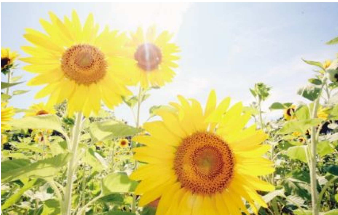
マリンパーク御前崎のひまわり