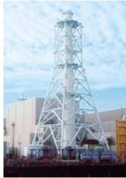
川内原子力発電所

4 新潟県中越沖地震を踏まえ、地震に対する安心感の向上として、 4項目の新たな対応事項への取り組み説明がありました。また、