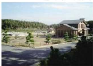
高松浄化センター

いて白羽、御前崎地区の下水道処理方法を池新田、高松と同様のオキシデーショニング法で整備する方向で意見がまとまり、21年度より設計に着手することになりました。