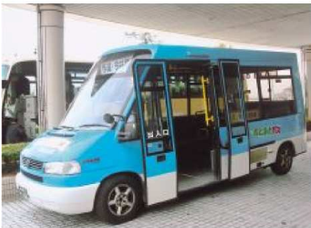
自主運行バス(射水市)