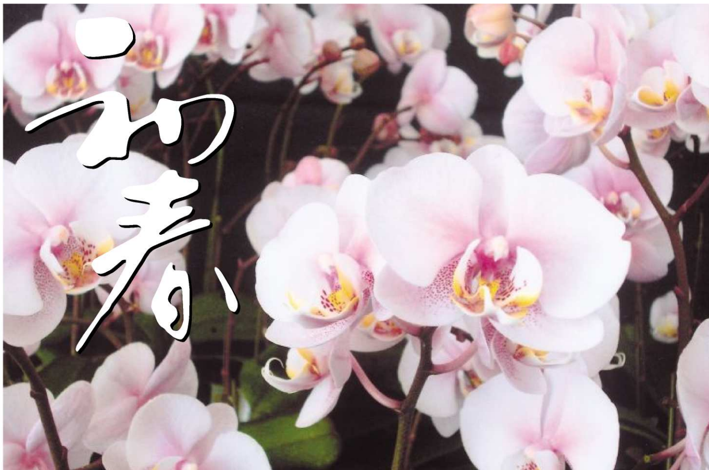
新春を彩るコチョウラン