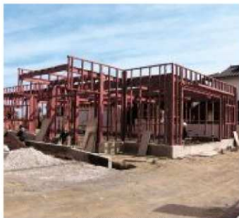
つばきの家(建設中)