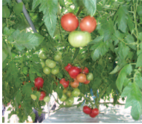
水耕栽培の実証実験(トマト)