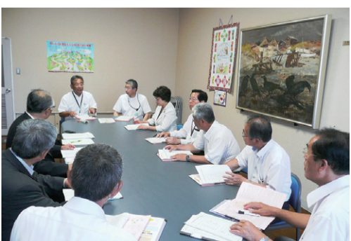
御前崎中学校での意見交換