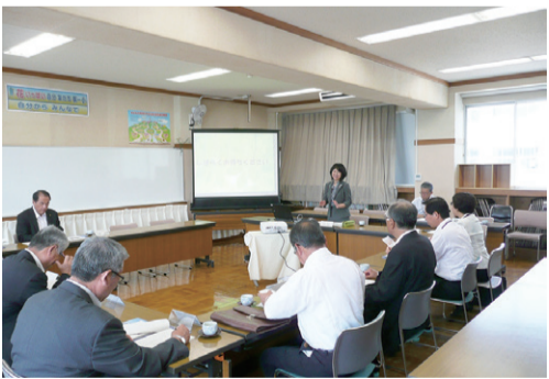
第一小学校での意見交換