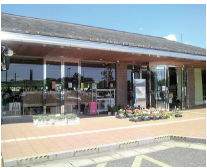
道の駅八王子滝山

視察先及び視察内容 (平成25年8月27日) ○道の駅八王子滝山 (東京都八王子市) ・(株)ウエイザ(市農業振興拠点施設指定管理者)の最優先交渉権者が現在指定管理者となっている道の駅八王子滝山の運営状況調査