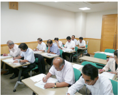
運営状況の説明を受ける委員