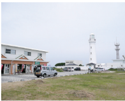
犬吠埼灯台と周辺施設

○犬吠埼灯台・灯台資料展示室 (千葉県銚子市) ・灯台を活かした観光事業への取り組み調査