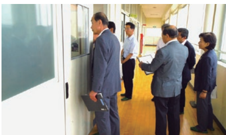
浜岡中 廊下から授業を見学