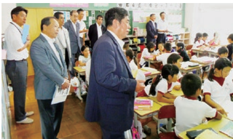
浜岡東小 授業風景