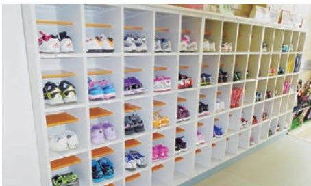
第一小 きれいに整頓された児童の靴