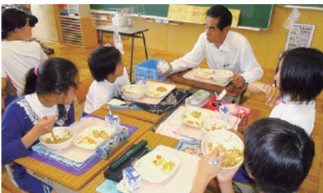
御前崎小 給食時の様子