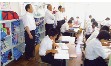
御前崎中 授業風景