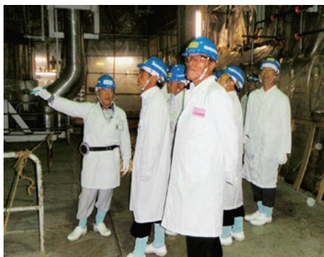
原子炉廃止措置研究開発センター

○（独法）日本原子力研究開発機構 原子炉廃止措置研究開発センター（略称・ふげん） （福井県敦賀市） 廃炉措置の現状を視察し、廃棄物の処理方法などの説明を受けました。