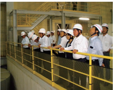
中部電力榑上越火力発電所

○ 中部電力榑上越火力発電所（新潟県上越市） 新設されたLNG（液化天然ガス）火力発電所を視察しました。