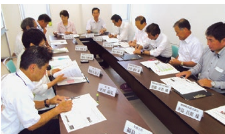
白羽小 校長らとの意見交換