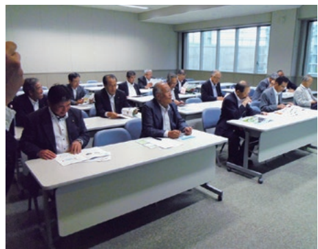
若狭湾エネルギー研究センター

○（独法）日本原子力研究開発機構 原子炉廃止措置研究開発センター（略称・ふげん） （福井県敦賀市） 廃炉措置の現状を視察し、廃棄物の処理方法などの説明を受けました。