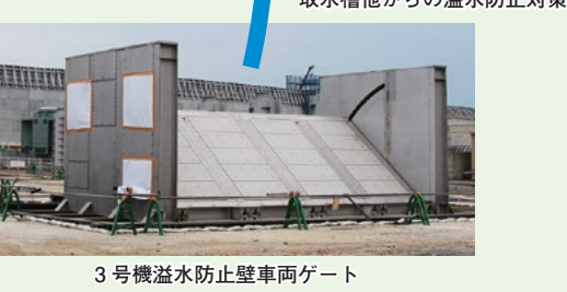
3号機溢水防止壁車両ゲート