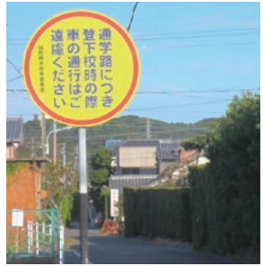
新しく設置された看板

ます。道路幅は狭いが、過去に危険だという報告はありません。また、狭いがゆえに一般の通り抜け車両の進入なども少ないと聞いています。しかし、保護者の気持ちを重く受け止め、本年度、要望路線の合同点検を関係者で行い、そこで出た意見をもとに、通学路の看板設置や横断歩道及び停止線の塗り替え、破損している側溝の取り替えなどの安全対策の実施を予定しています。