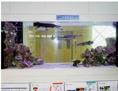
好適環境水～海の魚と川の魚と一緒に泳ぐ水槽～

・漁業対策としての好適環境水を利用した陸上養殖について 水にわずかな電解質を加えることで海水魚と淡水魚が同じ水槽内で生育できるという好適環境水を利用した海水魚の養殖の現状を視察しました。