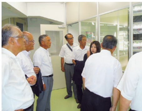
植物工場にて説明を受ける委員

可動型ソーラーシステムによる電力を活用した工場(やさい蔵)でクレソン、バジル、ルッコラ、イタリアンパセリなどの栽培の様子を視察しました。