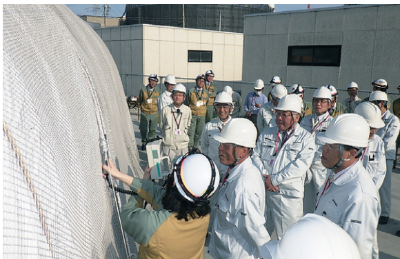
旧低圧タービン車軸の放射線測定

国のクリアランス制度に基づき認定を受けた5号機の旧低圧タービンの軸と動翼の保管状況などを視察しました。現地では、クリアランス物からの放射線についての説明や放射線測定を行い、放射線量は、自然放射線と比べ極めて低いレベルであることを確認しました。