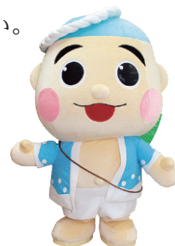
御前崎市マスコットキャラクター なみまる

〒437-1692 静岡県御前崎市池新田 5585 TEL (NTT・CATV) : 0537-85-1115 / FAX : 0537-85-1139 E-mail : gikai@city.omaezaki.shizuoka.jp