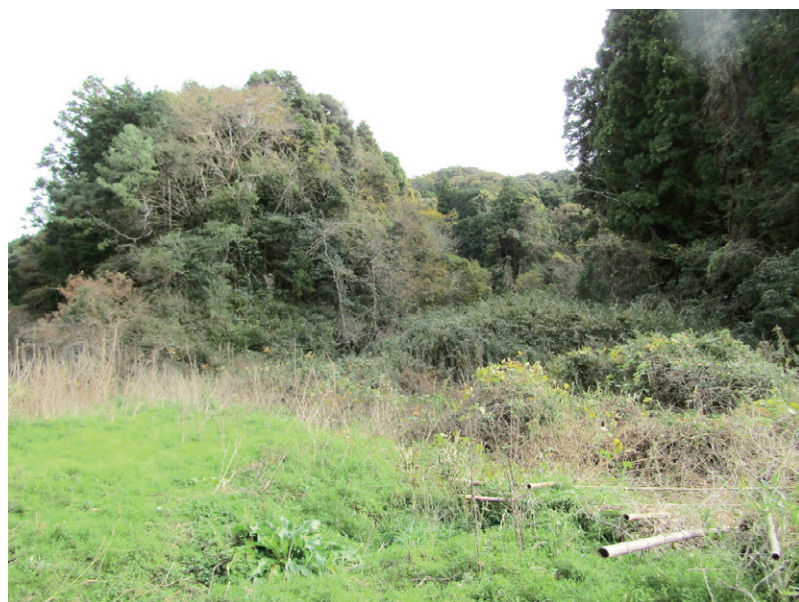
新野地区工業用地予定地

「今後の企業誘致の取り組みについて」は、電源地域の本市の優位性を活かした業種の誘致を積極的に進め、当該業種の企業と誘致に向けた情報交換を引き続