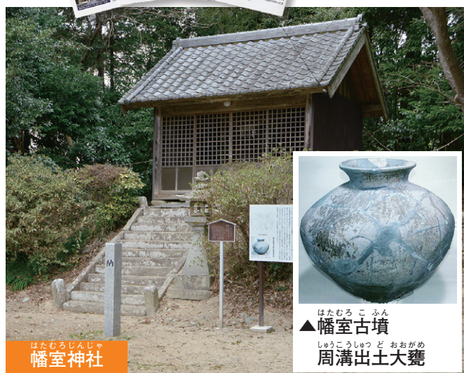
はたむろじんしゃ 幡室神社