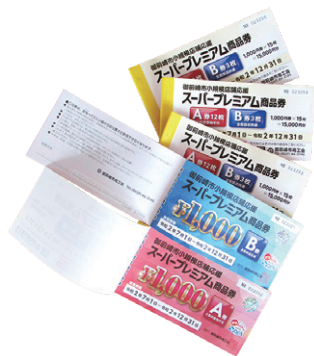
スーパープレミアム商品券

これらが一過性に終わらず、持続していくことが重要であり、今後、政府の経済対策を注視しながら、市内経済の活性化に向け施策の展開を図りたいと思えます。