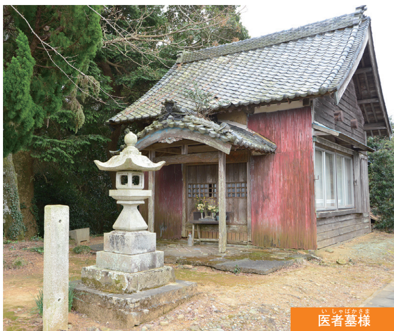
いしゃはかま 医者墓様