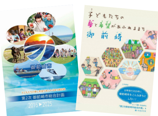
第2次 御前崎市総合計画

の社会情勢を考慮して、人口減少や人口流出に対応する地方創生の実現、デジタル化、SDGs、新型コロナウイルス感染症対策後の社会構造の変化への対応、脱炭素化社会の構築については、重点的に検討を進めています。