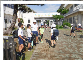
白羽小伝統の「あさしおごはん」

「おはようございます。」昇降口でのあさしおごはん委員会の元気な挨拶から始まる白羽小の一日。「あさしおごはん」とは、相手を思いやる大切な言葉として、平成5年から受け継がれている挨拶の合言葉です。