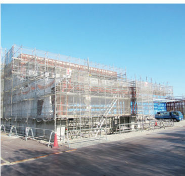
新学校給食センター（令和3年1月15日現在）