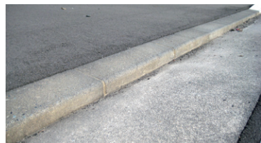
歩道と車道の段差