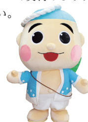
御前崎市マスコットキャラクター なみまる

E-mail : gikai@city.omaezaki.shizuoka.jp