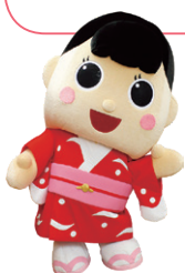
御前崎市マスコットキャラクター ふうちゃん