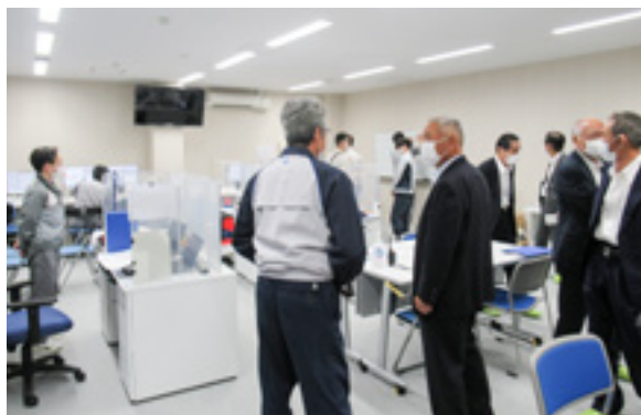
石狩バイオマス発電所