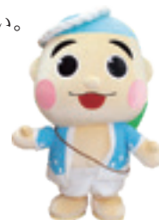
御前崎市マスコットキャラクター なみまる

〒437-1692 静岡県御前崎市池新田 5585 TEL (NTT・CATV) : 0537-85-1115 / FAX : 0537-85-1139 E-mail : gikai@city.omaezaki.shizuoka.jp