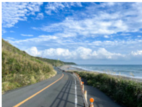
御前崎ロングビーチ

答 現代の観光客は「今だけ、ここだけ、あなただけ」の満足を求めています。県道佐倉御前崎港線の尾高の坂を過ぎたあたりから見える御前崎ロングビーチと灯台、鮮度が良く値段も安い魚介類などはここにしかない魅力であると感じます。この魅力を商品の域にまで高めることが重要です。商品化の推進役が「DMO」です。