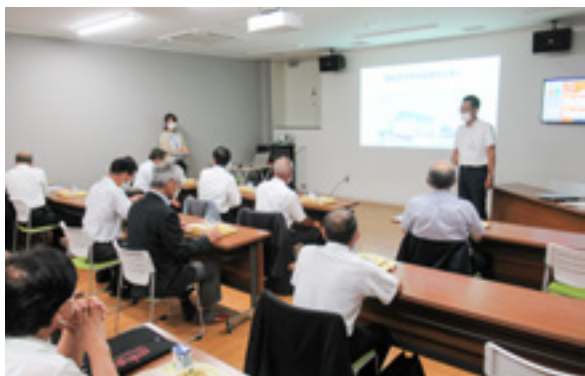
御前崎市学校給食センター

御前崎市学校給食センターの現 在の状況を視察しました。安全・ 安心な給食を提供するための徹底 した衛生管理、食物アレルギー対 応への取り組みなどの説明を受け た後、実際に給食を試食しました。