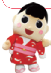
御前崎市マスコットキャラクター ふうちゃん