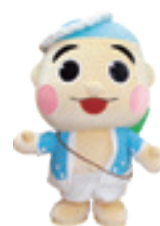
御前崎市マスコットキャラクター なみまる

〒437-1692 静岡県御前崎市池新田5585 TEL(NTT・CATV): 0537-85-1115 / FAX: 0537-85-1139 E-mail: gikai@city.omaezaki.shizuoka.jp