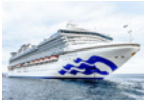
ダイヤモンドプリンセス号 全長290m 船籍港ロンドン 9月14日入港予定

灯台前広場は、敷地面積や進入路が狭く大型車両でのアクセスが難しい状況です。通常は潮騒の像周辺の駐車場を利用していますが、クルーズ船客などの階段の上り下りには配慮を検討します。乗船客のイチゴ狩り体験などは、農業者の意見も参考にし、検討したいと思っております。