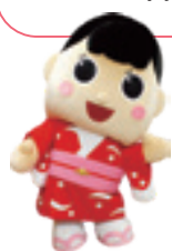
御前崎市マスコットキャラクター ふうちゃん