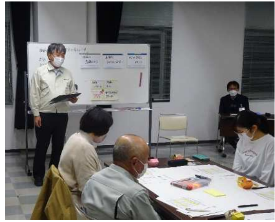
学校教育課長 説明 法律に基づく教職員の配置について