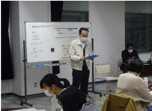
教育総務課長 説明 現在と今後の中学校について