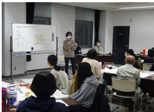
進行 一般財団法人CLIP