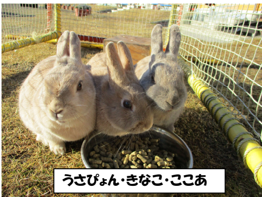
うさびょん・きなこ・ここあ