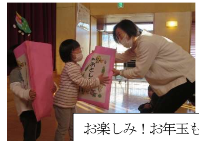
お楽しみ!お年玉も!

みんなで賑やかな「おめでとうの会」をすごしました。この後、温かいお汁粉も食べてほっこりしました。