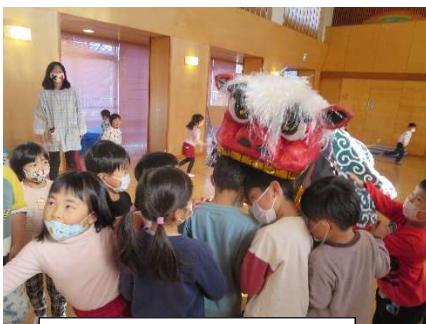
獅子舞登場に大騒ぎ