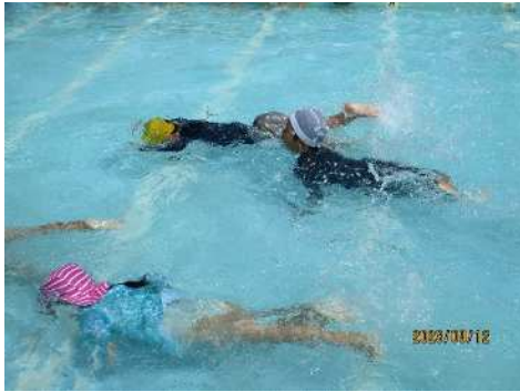
プール納め 大きなプールで潜ったり、泳いだりできるようになったことを自信たっぷりで披露してくれました。