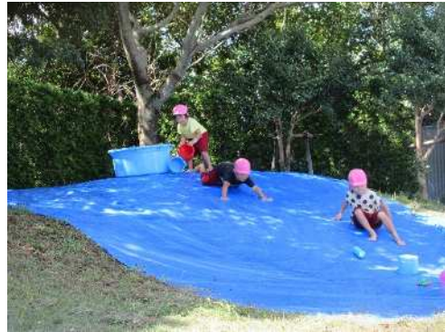
残暑厳しい9月、ウォーターライダーでもダイナミックにたくさん遊びました。