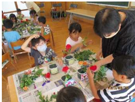
祖父母参観前には、おじいちゃんおばあちゃんのためにおやつを作り、フラワーアレンジメント体験(プレゼントの花)もできました。