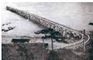
▲昭和23年、建設の始まった東防波堤