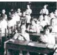
▲昔の昼食(おべんとう) 1953(昭和28)年ころ