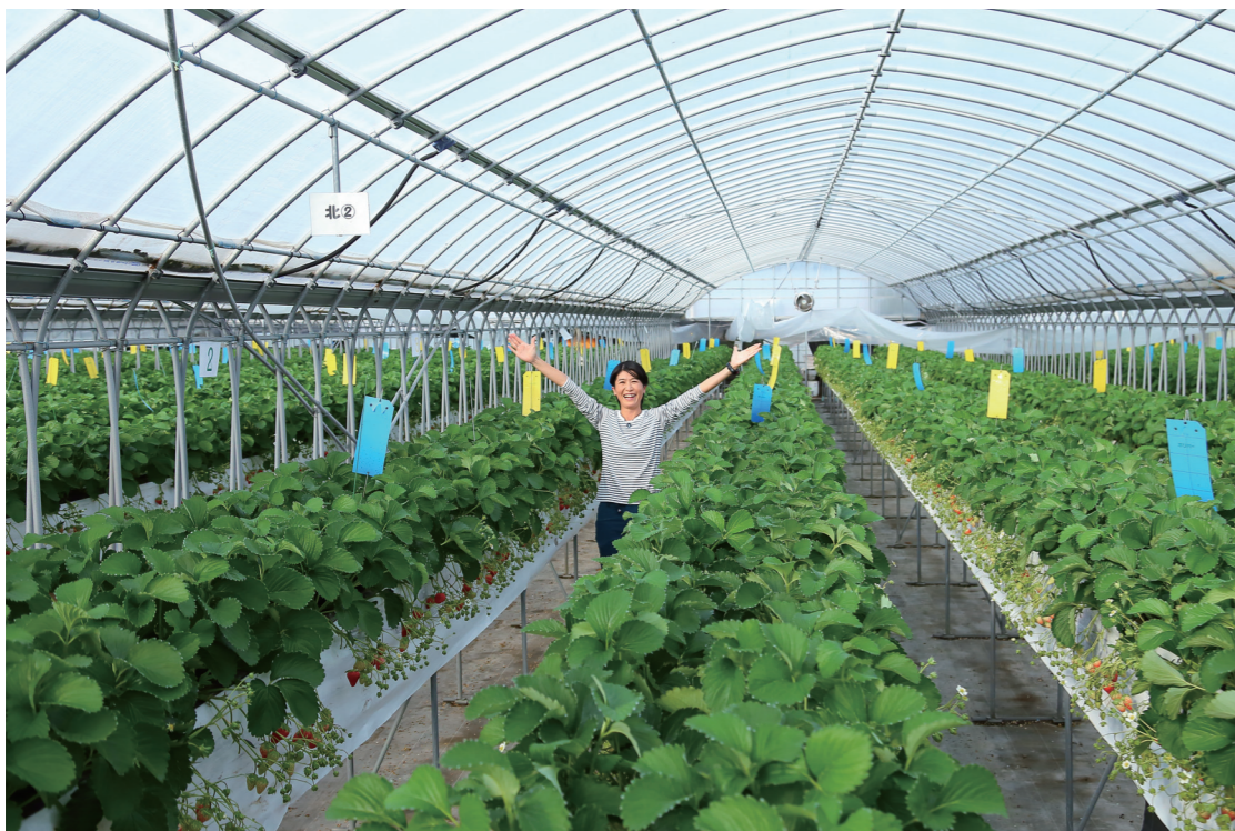
ハウス全体で約13,500本の苗が植わり、毎年1シーズンで約13トンのイチゴを出荷。イチゴは甘みだけでなく、コク、酸味、香りがある、見た目の輝きがいいと評判。きっちり基本に忠実に栽培のコツ。イチゴの葉も生き生きとしている。

営む主人との約束で、お互いに繁忙期でも夕方6時まで、日曜日は必ず休むと決めています。夫婦で旅行に行くのが楽しみです。プライベートも充実しないと、いい仕事はできないですからね。農家も普通の会社を起業するのと同様、経営者という視点が大切だと思いますね。 今後は、新卒でもすぐに就農・起業できるように「仕組み」を後輩たちのために作るのが私の大きな夢です。