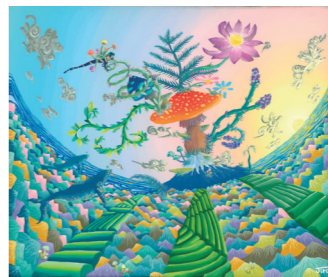
題名 / home

長野県出身。大学卒業後、企業に就職するが、「本当に夢中になれるもの」を見つけるために退職し、ワーキングホリデーで海外を転々。カナダでワーキングホリデーをしていた御前崎出身の奥様と出会い結婚。長女、長男の4人暮らし。同じ敷地内には奥様の両親、祖母も一緒に暮らしている。