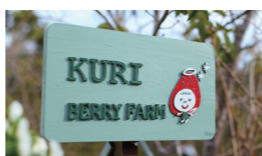
農園名は「KURI BERRY FARM」。「幸せのリング、光るいちご。」の名でブランド化も。