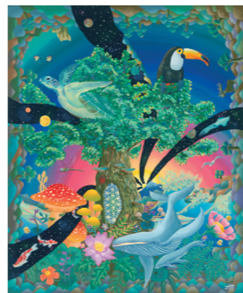
題名 / Come out

2階ホールの一隅にあるアート空間。絵は独学で、ある日ふと描き始めた。2020年から展示会を開いたり、アート展に出展したりするように。2021年の秋にはJパリの「ルーブル美術館」地下会場作品を披露する。