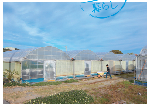
全長約30mのハウスが連なり、ハウスの総面積は2,100㎡。

営む主人との約束で、お互いに繁忙期でも夕方6時まで、日曜日は必ず休むと決めています。夫婦で旅行に行くのが楽しみです。プライベートも充実しないと、いい仕事はできないですからね。農家も普通の会社を起業するのと同様、経営者という視点が大切だと思いますね。 今後は、新卒でもすぐに就農・起業できるように「仕組み」を後輩たちのために作るのが私の大きな夢です。