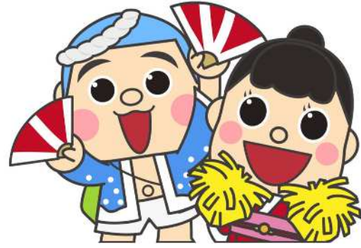
御前崎市マスコットキャラクター なみまる ふうちゃん