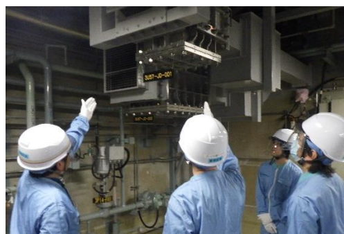
浸水防止ダンパの点検の様子