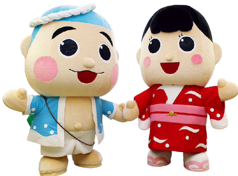
御前崎市マスコットキャラクター 「なみまる」 「ふうちゃん」