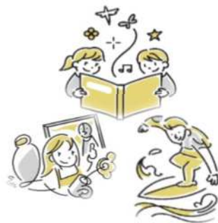
学術文化向上、体育の振興