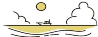
自然環境の整備、保全