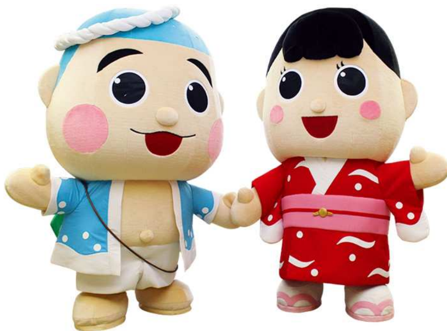
御前崎市マスコットキャラクター 「なみまる」 「ふうちゃん」