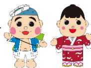
御前崎市公式キャラクターなみまる、ふうちゃん